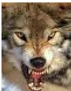
Lupo ... disturbato